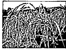
ระยะรุนแรงของโรคไหม้ในรวงข้าว กรมการข้าว กระทรวงเกษตรและสหกรณ์

กลุ่มเมล็ดพันธุ์ด้วยสารป้องกันกำจัดเชื้อรา เช่น คาชูกาไมจิน ไตรโซคลาโซล คาร์เบนดาซิม โพรคลอราซ ตามอัตราที่ระบุ ในแหล่งที่เคยมีโรครุนแรงและพบแผลโรคไหม้ทั่วไป ๕ เปอร์เซ็นต์ของพื้นที่ใบ ควรฉีดพ่นสารป้องกันกำจัดเชื้อรา เช่น คาชูกาไมจิน อิติเฟนฟอส ไตรโซคลาโซล ไอโซโทโรโลเลน คาร์เบนดาซิม